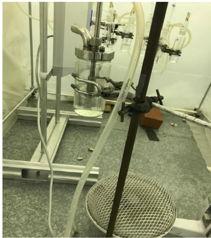
Posizione del ventilatore sotto l'uscita dal nebulizzatore