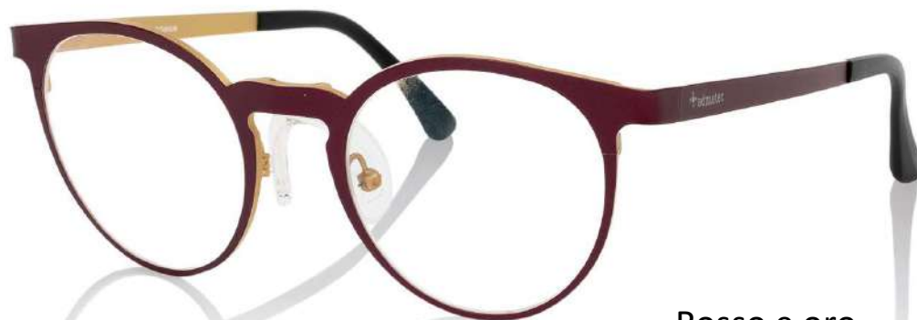
Rosso e oro