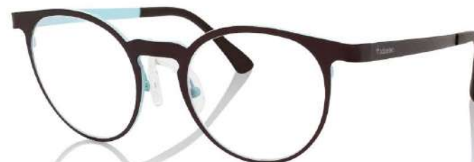
Marrone e blu