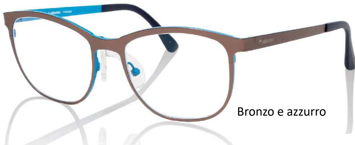
Bronzo e azzurro