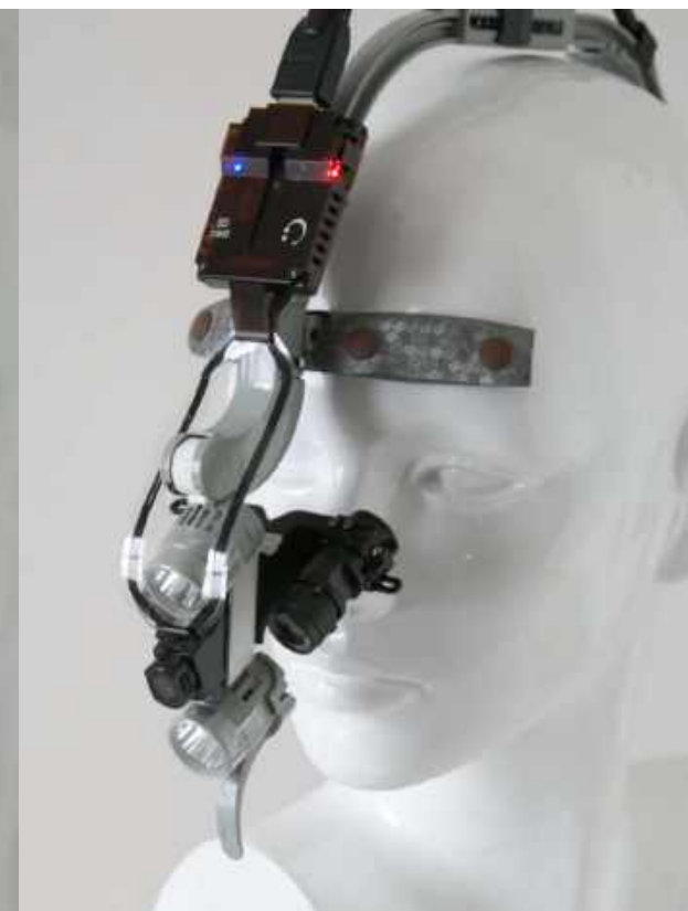
TELECAMERA FULL HD